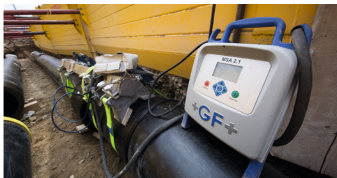
Installation der Komponenten vor Ort bei der Max Schetter AG.

Eine patentierte Technologie, die aktive Armierung, sorgt bei den Rohren für eine langanhaltende und sichere Verbindung. Dazu wird schon bei der Herstellung der Armierungsring mit hohen Kräften über den Innenring gepresst. Während des Schweissprozesses verringert die Wärme die Steifigkeit des inneren Rings, der Armierungsring drückt von aussen. So können grössere Spalten schneller und sicher geschlossen werden.